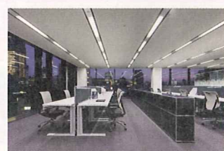
PMO日本橋本町モデルオフィス