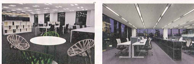
PMO秋葉原モデルオフィス