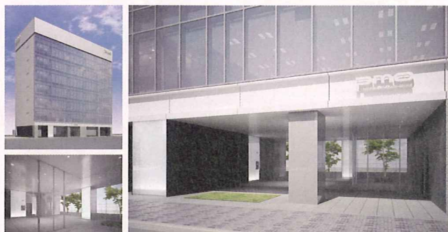
PMO秋葉原II 完成予想図(完成予想図はイメージです。実際の仕様とは異なる場合があります)

※上記の「PMO秋葉原II」完成記念イベント以外の日時についても個別でご案内可能です。お気軽にお問い合わせください。